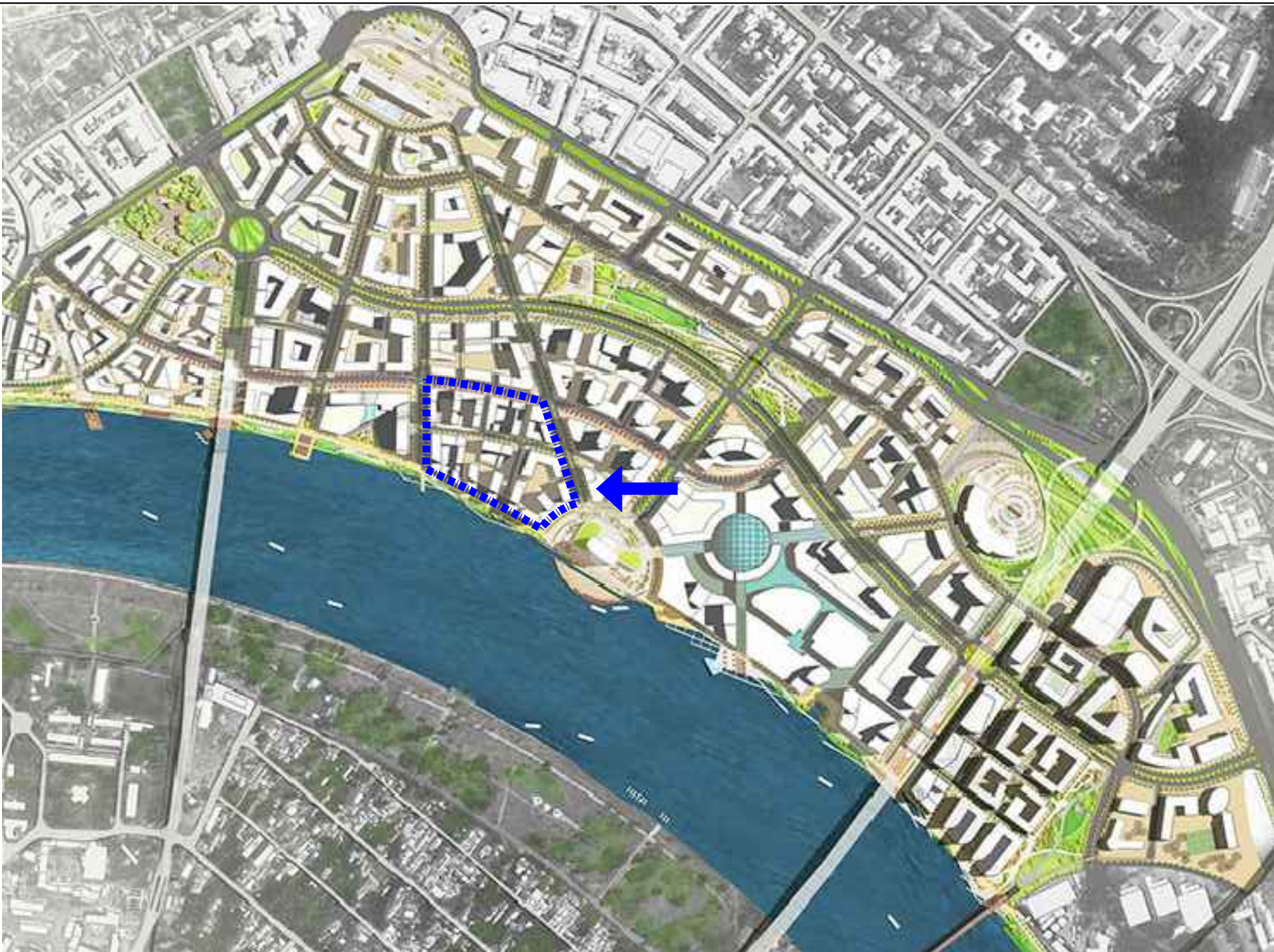
SLIKA 1. PROSTORNO PORGRAMSKO REŠENJE MASTER PLANA "BELGRADE WATERFRONT "